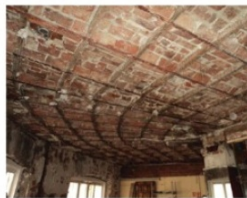
Tipología General de Forjados Edificio Original (Zonas de Esquinas)